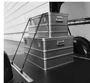
▲ Houten laadvloer

Verankeringsysteem in de zijwand met twee sjerriemen