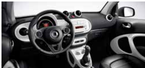
Dashboard en deurpanelen in stof zwart en accentdelen in wit en zetelbekleding in zwart leder met witte siernaden