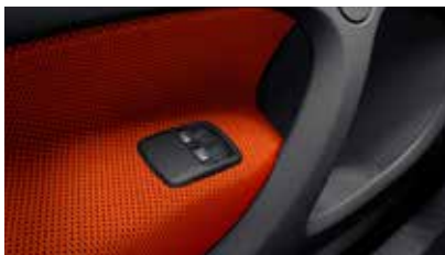
Elektrische ruitbediening met comfort functie en obstructie sensor