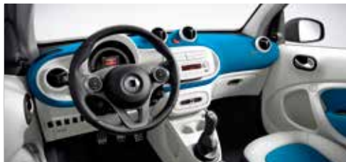
Dashboard en deurpanelen in stof blauw en accentdelen in wit en zetelbekleding in lederlook/stof wit/blauw