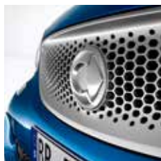
cool silver (metallic) [4U4]