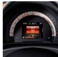
Spoorassistent met zicht- en hoorbare waarschuwingssignalen