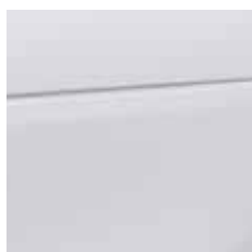
moon white (matt) [EDEO]