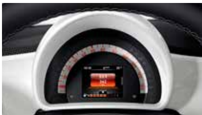
Combi-instrument met tft-kleuren-display en boordcomputer