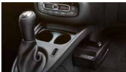
Middenconsole met schuiflade en dubbele bekerhouder voor, enkelvoudige bekerhouder achter