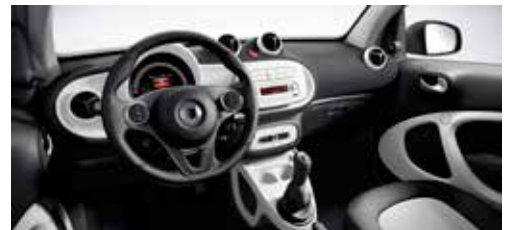
Dashboard en deurpanelen in stof zwart en accentdelen in wit, zetelbekleding in stof zwart/wit