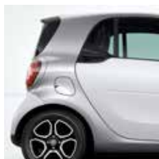
cool silver (metallic) [EN2U]