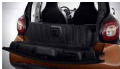
Opbergvak in kofferklep