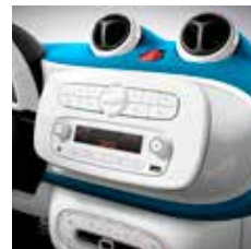
Cool & Audio-pakket