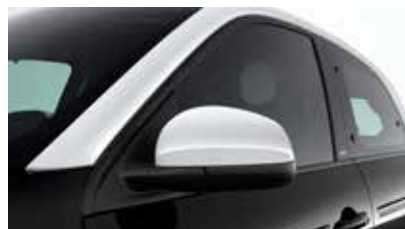
Buitenspiegels in tridion kleur