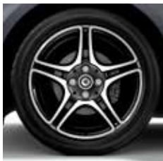
40,6-cm (16 inch) vijf-dubbelspaaks lichtmetalen velgen, zwart, glanzend