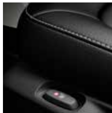
Zetelverwarming voor bestuurder en passagier