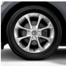
38,1-cm (15 inch) achtpaaks lichtmetalen velgen, zilverkleurig