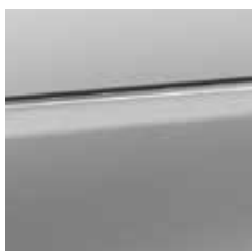
cool silver (metallic) [EDAO]