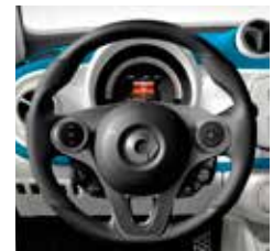
Sport-pakket: multifunctioneel sportstuur in leder