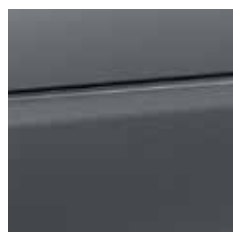
titania grey (matt) (metallic) [EAIO]