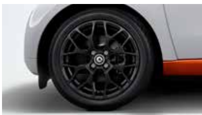
40,6-cm (16 inch) 8Y-spaaks lichtmetalen velgen, zwart, met banden 185/50 R16 voor, 205/45 R16 achter