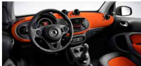
Dashboard en deurpanelen uitgevoerd in stof oranje. Accentdelen in zwart/grijs en zetels bekleed met stof zwart/oranje