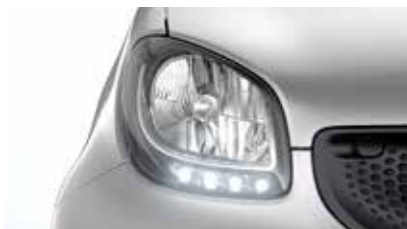
H4-halogeenkoplampen met geïntegreerd led-dagrijlichten