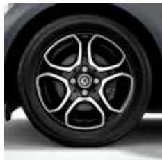
38,1-cm (15 inch) vijf-dubbelspaaks lichtmetalen velgen, zwart, glanzend