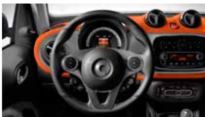
Driespaaks multifunctioneel stuurwiel in leder